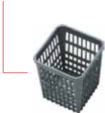
Besteckköcher mit einem Besteckfach